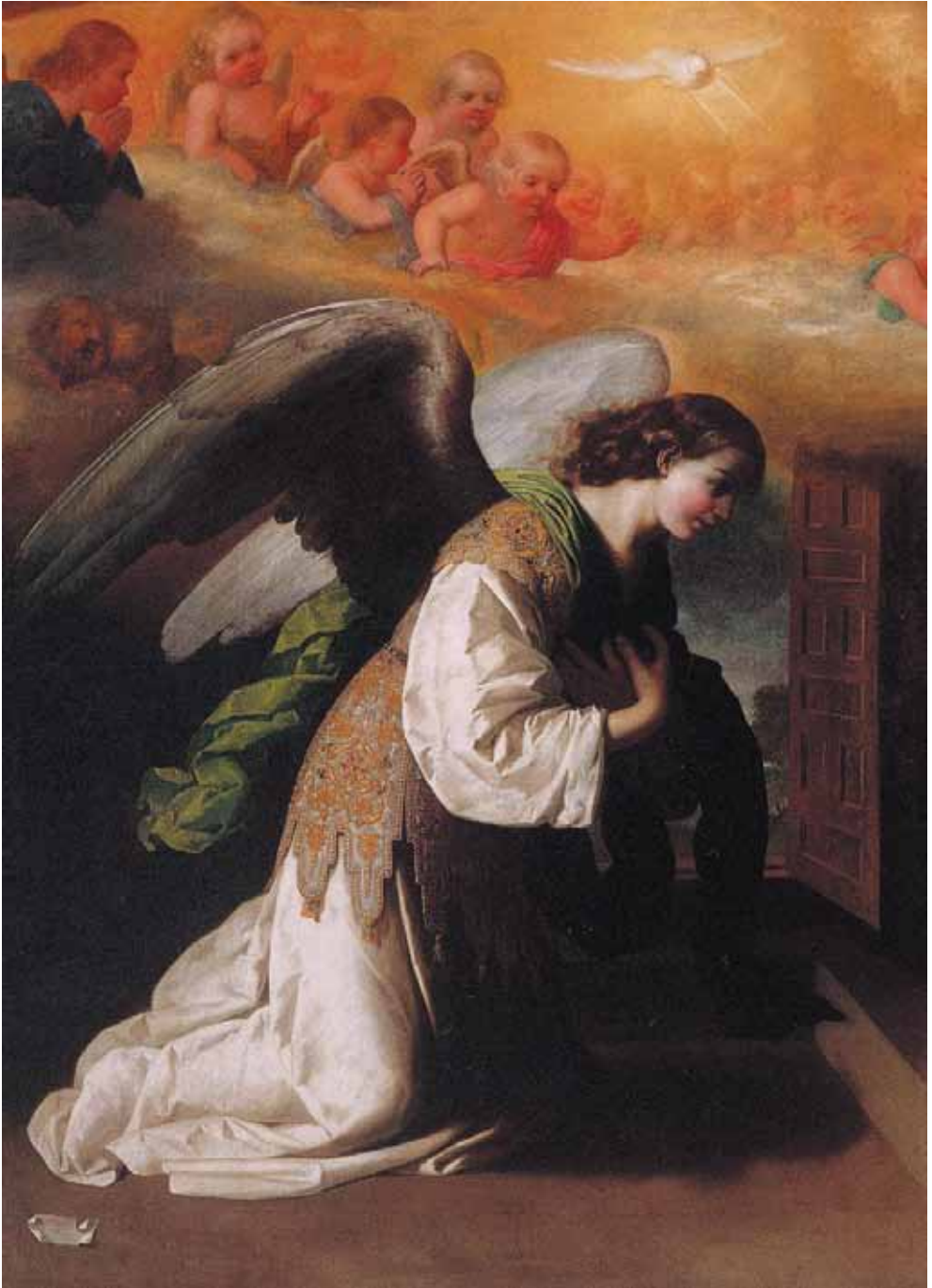
L'Annonciation , Francisco de Zurbarán, vers 1650, 213 x 314 cm, Philadelphia, Museum of Art