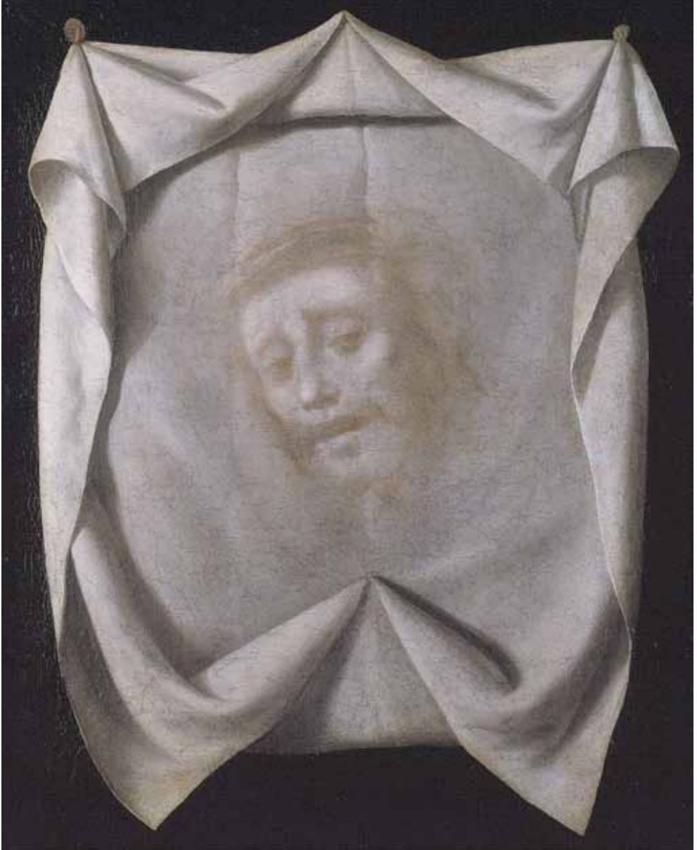
Le Voile de Sainte Véronique , Francisco de Zurbarán, vers 1635, 70 x 51 cm, Stockholm, National museum