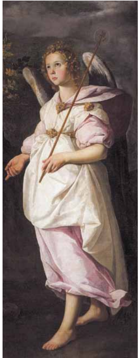
L'Ange Gabriel , Francisco de Zurbarán 1631-1632, 145 x 60 cm Montpellier, Musée Fabre