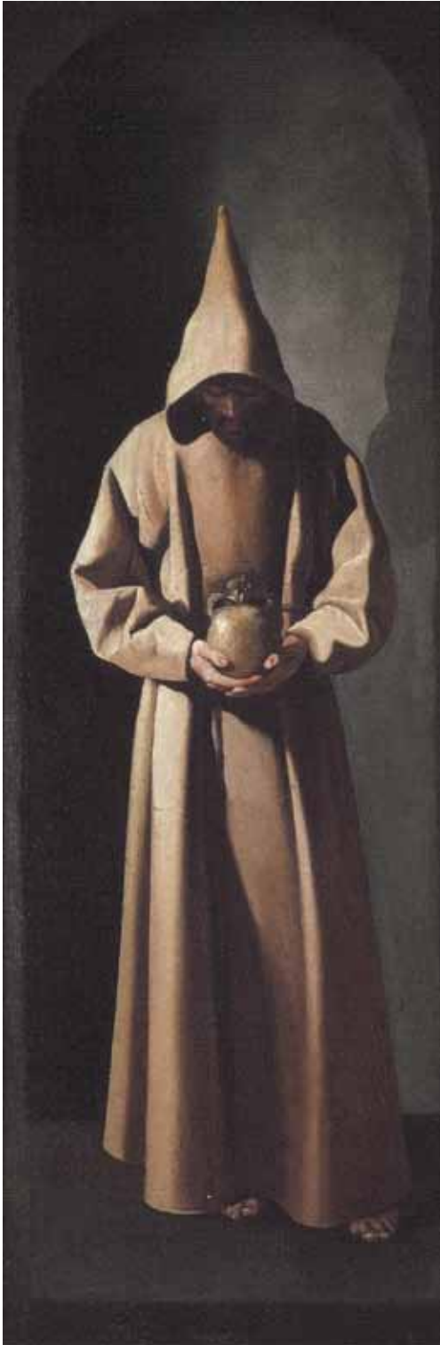
Saint François debout , Francisco de Zurbarán, vers 1635, 91,5 x 30,5 cm, Saint Louis, Art Museum